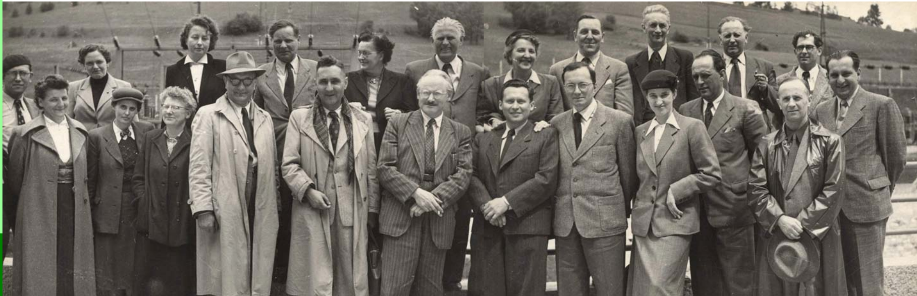
Dir. Josef Ilias